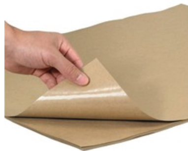
HOJAS PARA TROQUELADO (MIN 1 TON)