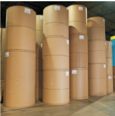
BOBINAS MASTER (1 TON)